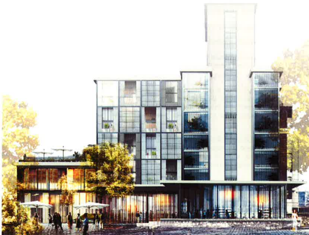
L'idée retenue : logements et commerces