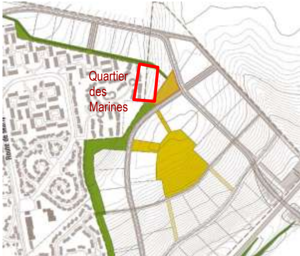
Situation de la résidence des Marines par rapport à l'interruption de la coulée verte

L'EPA Plaine de France a entendu les remarques et inquiétudes des riverains, qui se sont exprimées lors de la promenade commentée. Le plan d'aménagement sera retravaillé sur ce secteur et un atelier de concertation spécifique sera organisé quand les études auront avancé.