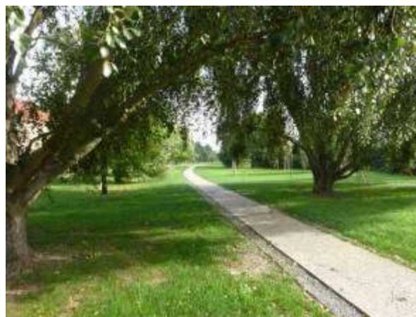
Exemples de chemins

Les participants des deux tables rondes ont longuement parlé des ambiances de la coulée verte et de la végétation qu'ils souhaiteraient y trouver. Ils se sont majoritairement exprimés en faveur d'un parcours sinueux, qui réserve des surprises, et planté avec des végétaux faciles à entretenir. La coulée verte a vocation à être un espace de promenade, il ne faut donc pas qu'elle soit rectiligne. Les participants approuvent l'idée des paysagistes de HYL de faire évoluer les ambiances et les végétaux au fil du parcours, de façon à ce que la coulée verte ne soit pas identique partout.