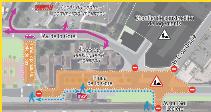
Fermeture du carrefour à la circulation ▲

▼ Itinéraire de déviation mis en place la nuit du 28 au 29 novembre