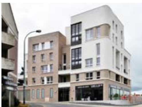
2 Immeuble témoin Nexity Apollonia/I3F