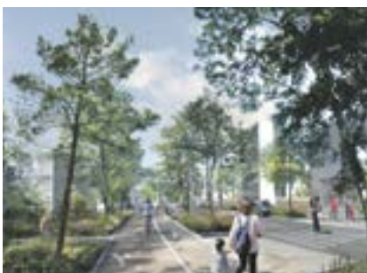
3 La rue Basse