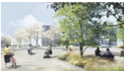
2 La place des Frais-Lieux