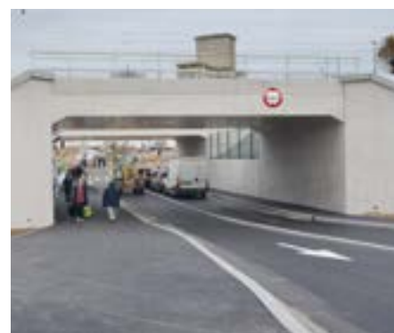
3 Le nouveau pont de la gare