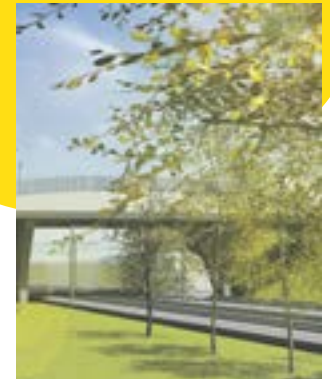
4 Un nouveau pont au dessus des voies ferrées