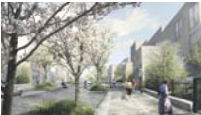
1 La rue des Frais-Lieux

2050 logements 1 parc 2 groupes scolaires 1 nouveau pont 6 ha d'espaces verts