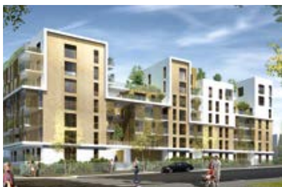
1 La résidence Les Prairies d'Icade