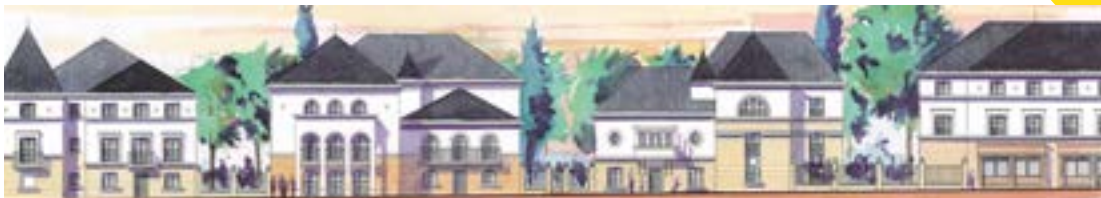
1 Logements Antin Résidences ©Breitman Architectes

440 logements, des équipements sportifs et l'agrandissement de l'école